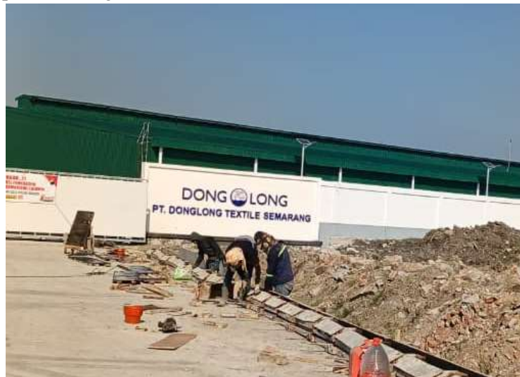
Gambar 1. Gate PT Donglong Textile Semarang

Donglong Group merupakan grup manufaktur internasional yang didirikan pada tahun 1992 dan bergerak dalam produksi serta penjualan bahan bulu halus, tekstil rumah, bahan pengisi sintetis, dan produk garmen. Di Indonesia, Donglong Group mengembangkan usahanya melalui dua entitas, yaitu PT Donglong Textile Indonesia yang berdiri pada tahun 2023 di Kabupaten Jepara dan PT Donglong Textile Semarang yang didirikan pada akhir tahun 2024 di Kabupaten Sragen, Jawa Tengah. PT Donglong Textile Semarang menjadi cabang kedua yang berfokus pada manufaktur tekstil dengan orientasi pasar global, meliputi China, Jepang, Amerika Serikat, serta negara-negara di Asia dan Eropa. Sebagai perusahaan manufaktur dengan skala internasional, PT Donglong Textile Semarang mengedepankan nilai budaya perusahaan yang menekankan prinsip kepraktisan, kesederhanaan, dedikasi, serta komitmen terhadap kualitas produk. Filosofi dan strategi perusahaan yang berorientasi pada kualitas tinggi, internasionalisasi, dan transformasi menuju pasar kelas atas menuntut sistem pengelolaan internal yang efisien, khususnya dalam aspek administrasi dan pelaporan keuangan.