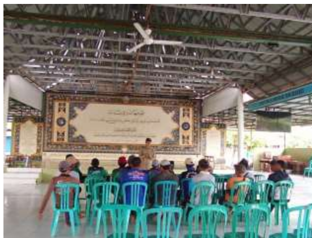
Gambar 2. Diskusi manajemen waktu puasa dan pengalaman pekerja fisik

Peserta kemudian merancang strategi konkret, seperti menjaga waktu sahur secara disiplin agar stamina tetap stabil, mengatur ritme kerja menjelang berbuka agar tidak berlebihan, memanfaatkan waktu istirahat untuk dzikir singkat, serta menghindari aktivitas yang tidak mendesak demi menjaga energi selama berpuasa. Pendekatan partisipatif ini membuat peserta terlibat aktif dalam menemukan solusi sesuai kondisi lapangan.