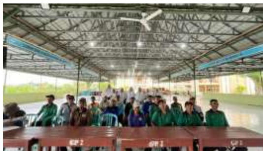
Gambar 3. Sesi muhasabah dan refleksi spiritual peserta

Dengan demikian, setiap rasa lelah yang dialami dengan sabar dan tawakal menjadi bagian dari proses penguatan iman. Pekerjaan dan ibadah tidak lagi dipandang sebagai dua hal yang terpisah, melainkan saling menguatkan dalam membentuk pribadi yang bertakwa.