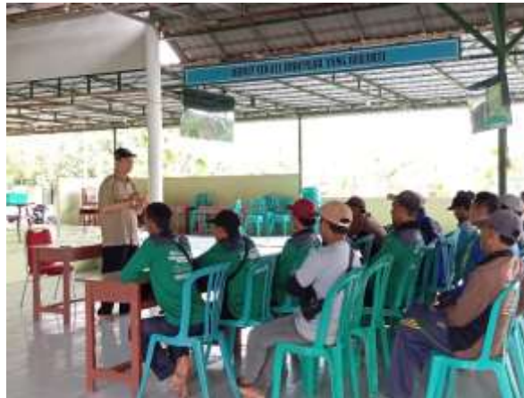
Gambar 1. Kajian penguatan manajemen ibadah bagi pekerja fisik

Dalam sesi ini ditekankan bahwa perbuatan baik memiliki dampak langsung terhadap kualitas hidup spiritual. Rasulullah SAW bersabda: