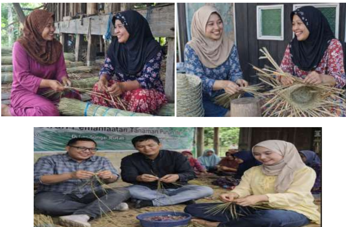
Gambar 1. Proses Pembuatan anyaman kerajinan tanaman Purun

Dengan demikian, kegiatan pengabdian ini tidak hanya memberikan dampak jangka pendek berupa peningkatan pengetahuan dan keterampilan masyarakat, tetapi juga membuka peluang pengembangan ekonomi desa dalam jangka panjang. Pemanfaatan tanaman purun sebagai bahan baku kerajinan menjadi langkah strategis dalam menciptakan produk unggulan desa yang memiliki nilai ekonomi tinggi. Keberlanjutan program ini memerlukan dukungan lanjutan berupa pendampingan intensif, inovasi produk, serta penguatan strategi pemasaran agar kerajinan purun dapat memberikan kontribusi nyata terhadap peningkatan kesejahteraan masyarakat Desa Sungai Rutas secara berkelanjutan.