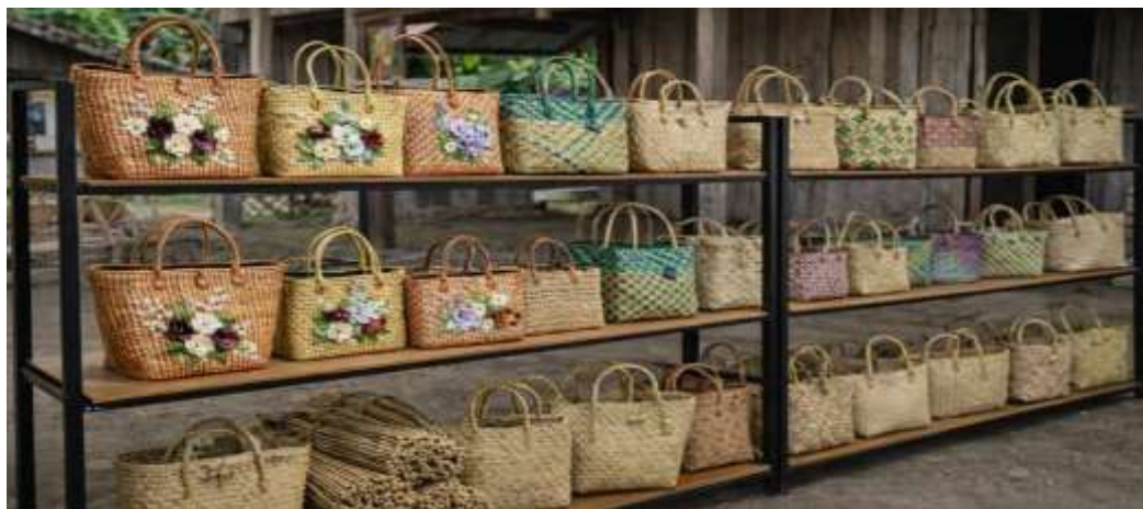
Gambar 2. Produk Olahan kerajinan dari tanaman Purun