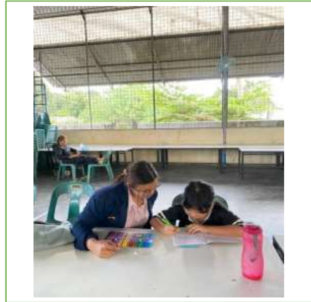
Gambar 3. Kegiatan Mahasiswa Mengajar Bimbel