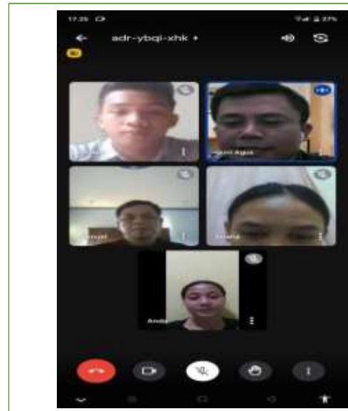
Gambar 4 Monitoring