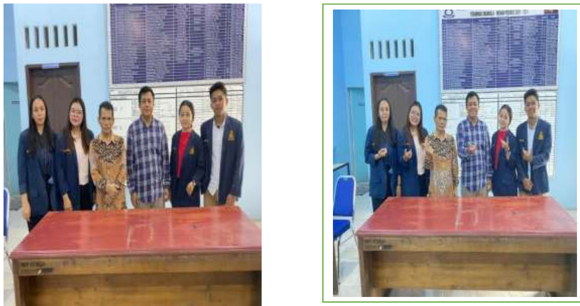
Gambar 5. Penjemputan Mahasiswa Pkm