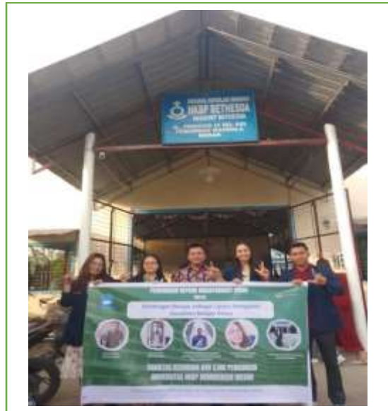
Gambar 1. Pengantaran mahasiswa PkM