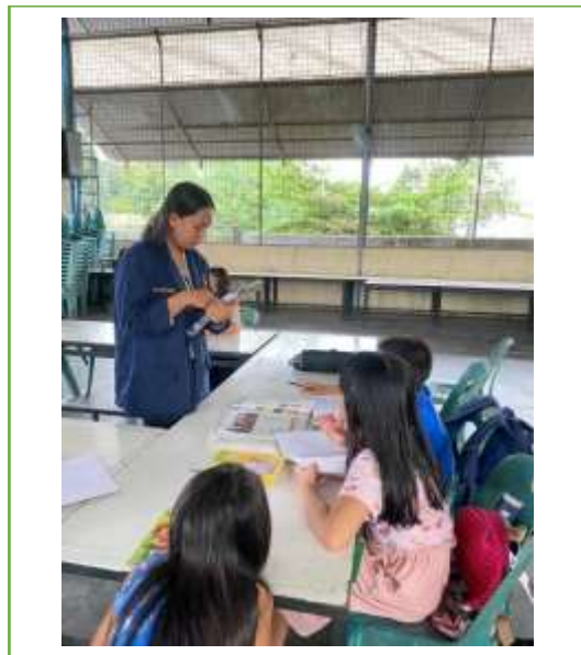
Gambar 2. Sosialisasi bersama peserta PkM