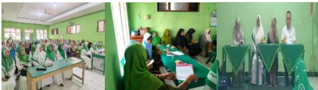
Gambar 3. Pelaksanaan Kegiatan Diskusi