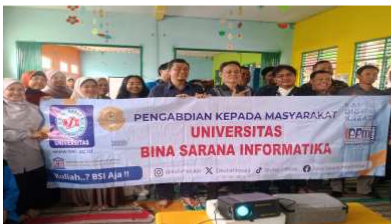
Gambar 4. Foto Kolektif Panitia dan Mitra

Kegiatan telah usai dengan ditandainya sesi dokumentasi, seperti yang tampak pada Gambar 4.