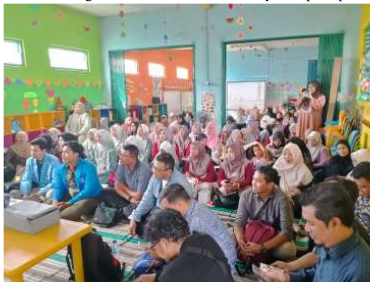
Gambar 3. Kegiatan Pelatihan Pembuatan Laporan Keuangan UMKM

Aktifnya peserta dalam mengikuti kegiatan pelatihan yang diwujudkan dalam bentuk komunikasi dua arah tampak pada Gambar 3. Peserta sangat antusias dalam menyimak pemaparan pemateri.