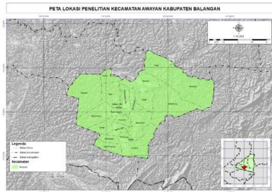
Gambar 1 Peta Lokasi Penelitian

Penelitian ini dilakukan pada Kecamatan Awayan Kabupaten Balangan. Penelitian ini dilakukan dari tanggal 20 mei 2024 sampai 19 maret 2025. Secara astronomis Kecamatan Awayan berada pada koordinat 2°25'1.26" Lintang Selatan dan 115°32'39.92" Bujur Timur. Kecamatan Awayan memiliki luas wilayah sebesar 142,57 kilometer persegi. Kecamatan Awayan berbatasan dengan Kecamatan Paringin Selatan dan Juai pada sebelah utaranya, di sebelah timurnya berbatasan dengan Kecamatan Tebing Tinggi dan di sebelah dan barat dan selatan berbatasan dengan Kecamatan Batu Mandi.