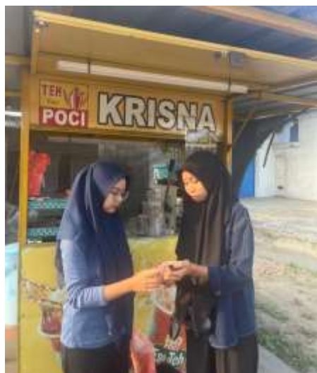
Gambar 19. Pendampingan UMKM Es Teh Poci Krisna