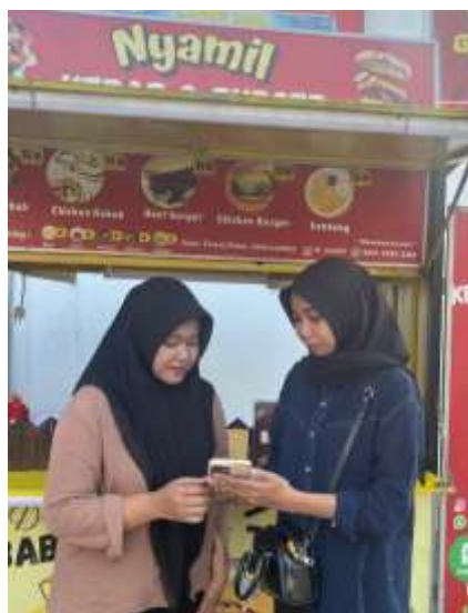
Gambar 23. Pendampingan UMKM Nyamil Kebab & Burger