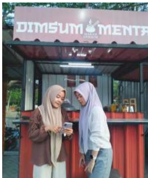
Gambar 10. Pendampingan UMKM UMKM Dimsum Mentai