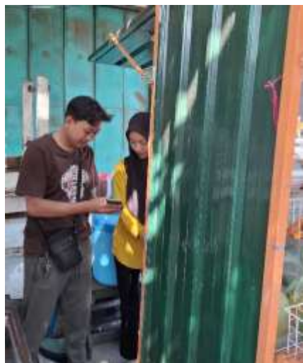
Gambar 18. Pendampingan UMKM Es Jeruk Peras