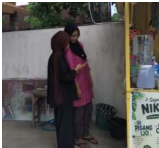
Gambar 2. Pendampingan UMKM Es Pisang Ijo