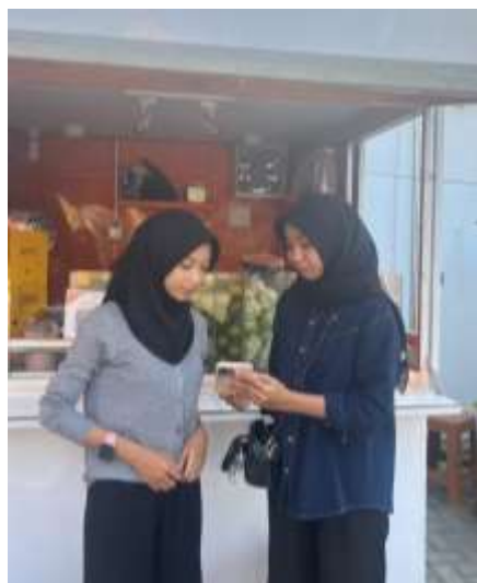
Gambar 21. Pendampingan UMKM Jus Buah Rara