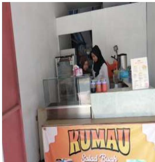
Gambar 6. Pendampingan UMKM Salad Buah