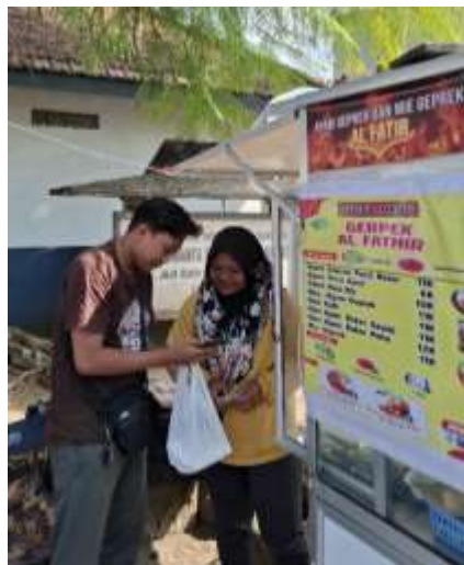
Gambar 14. Pendampingan UMKM Ayam Geprek Al-Fatir