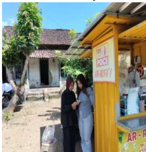
Gambar 4. Pendampingan UMKM Teh Poci Ar-Rifa'i