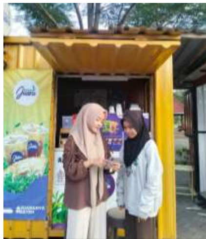
Gambar 12. Pendampingan UMKM Es Juara