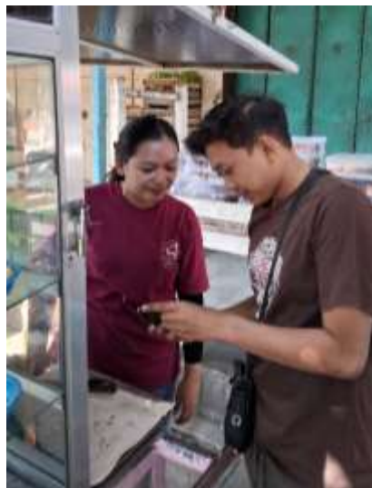
Gambar 16. Pendampingan UMKM Kue Basah