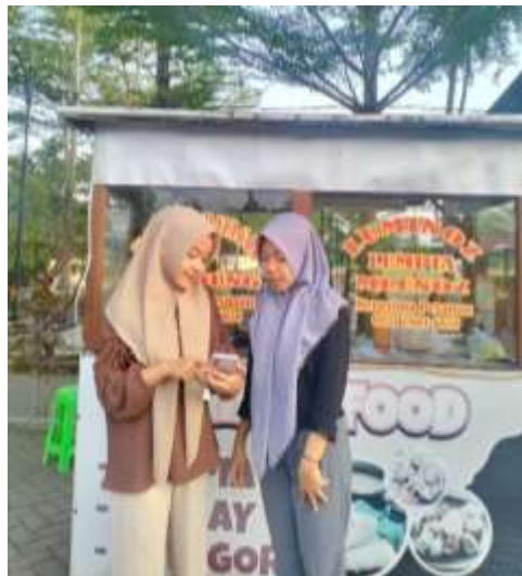
Gambar 8. Pendampingan UMKM Amirza Food