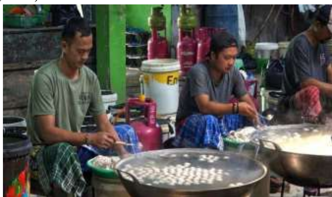
Gambar 1. Lokasi

Bakso ikan tuna merupakan inovasi pangan yang memanfaatkan bahan baku lokal menjadi produk yang lebih bernilai. Dibandingkan dengan bakso yang berbahan dasar daging sapi, bakso ikan tuna memiliki kandungan protein yang tinggi, rendah lemak, serta mengandung asam lemak omega-3 yang bermanfaat bagi kesehatan tubuh. Kandungan gizi tersebut menjadikan bakso ikan tuna sebagai salah satu produk pangan yang layak dikembangkan untuk memenuhi kebutuhan masyarakat akan makanan sehat dan bergizi (FAO, 2022; Junianto et al., 2024).