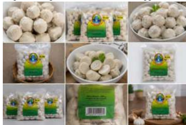
Gambar 3. Produk Bakso Ikan Tuna yang Telah Dikemas

Selain sebagai makanan siap konsumsi, bakso ikan tuna juga dapat diolah menjadi berbagai menu seperti bakso kuah, bakso goreng, maupun pelengkap makanan lainnya. Hal ini menunjukkan bahwa produk memiliki peluang untuk dikembangkan sebagai usaha skala rumah tangga.