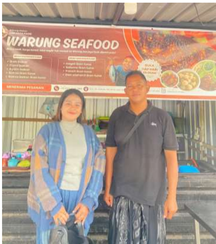
Gambar 4. Foto bersama owner