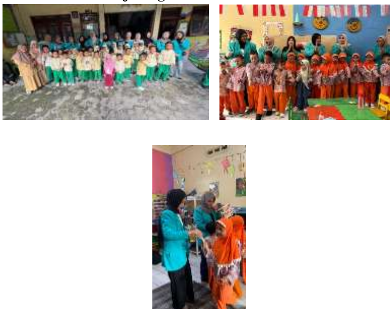
Gambar 1. Pegajaran di TK Aisyiyah Bustanul Athfal 51 Mojoso dan Foto Bersama