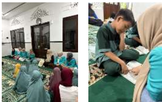
Gambar 2. Pengajaran TPA di Masjid Hidayah Mojosongo