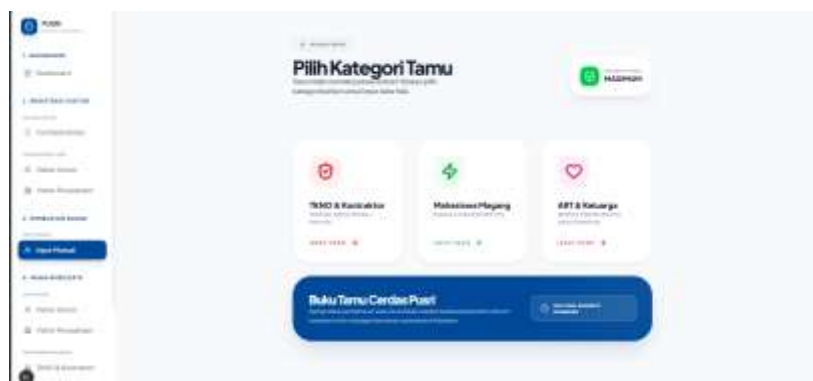
Gambar 3. Tampilan Halaman Pembuatan Badge

Halaman Pembuatan Badge memfasilitasi penerbitan badge digital yang memuat nama, nomor registrasi badge, dan area akses tamu, yang dapat dirender dan disimpan dalam format JPG untuk dicetak sebagai badge fisik.