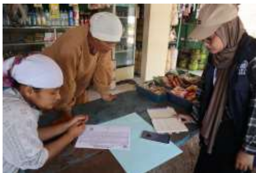
Foto Bersama Tim KKN dan Peserta Setelah Kegiatan Pendampingan NIB

Manfaat langsung yang dirasakan peserta antara lain kepemilikan legalitas usaha yang sah, peningkatan peluang untuk memperoleh dukungan pemerintah, dan tersusunnya data UMKM desa yang dapat digunakan sebagai dasar perencanaan ekonomi lokal.