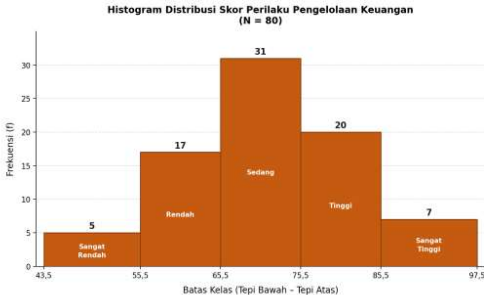
Gambar 2. Histogram Distribusi Skor Perilaku Pengelolaan Keuangan

Sebagaimana variabel sebelumnya, distribusi data perilaku pengelolaan keuangan juga divisualisasikan dalam bentuk histogram pada Gambar 2.