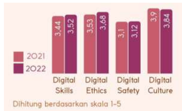
Gambar 1. Literasi Digital Indonesia

Berdasarkan infografis Literasi Digital Indonesia, pengembangan literasi digital nasional didasarkan pada empat pilar utama, yaitu Digital Skills, Digital Culture, Digital Ethics, dan Digital Safety. Keempat pilar tersebut saling berkaitan dalam membentuk masyarakat digital yang cakap, aman, berbudaya, dan bertanggung jawab. Jika dikaitkan dengan perilaku konsumsi masyarakat, keempat pilar tersebut memiliki kontribusi yang besar dalam membentuk pola konsumsi yang lebih rasional di era e-commerce.