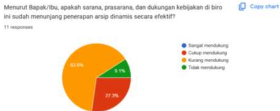
Gambar 1 Dukungan Sarana dan Kebijakan Arsip Dinamis LKPP

Berdasarkan hasil pra-riset, sebanyak 54,5% menilai penerapan arsip dinamis masih terbatas dan belum optimal, 27,3% menyatakan cukup berjalan baik namun belum konsisten, dan 18,2% menyatakan sudah berjalan baik dan teratur. Hasil ini menunjukkan bahwa penerapan arsip dinamis di Biro Hubungan Masyarakat dan Umum LKPP masih perlu ditingkatkan, baik dari segi fasilitas, integrasi sistem, maupun konsistensi pelaksanaan antarbagian agar efektivitas pengelolaan arsip dapat tercapai secara menyeluruh.