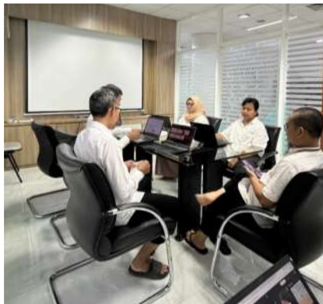
Gambar 4. Dokumentasi Penelitian