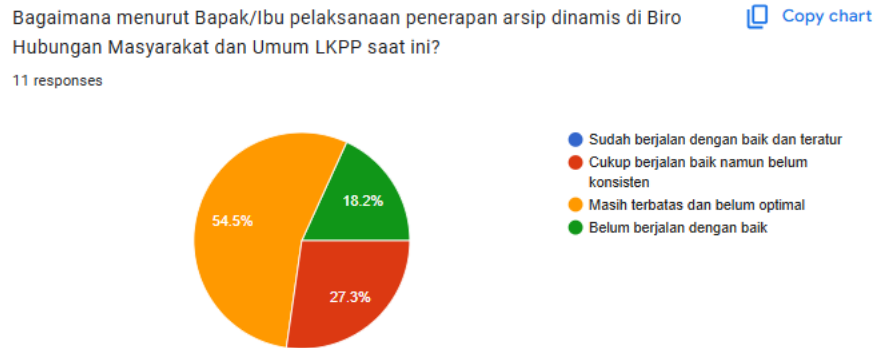
Gambar 1. Penerapan Arsip Dinamis di Biro Humas dan Umum LKPP

untuk mengetahui pandangan umum mereka mengenai penerapan arsip dinamis di biro. Hasil wawancara menunjukkan bahwa pelaksanaan arsip dinamis telah berjalan, namun belum sepenuhnya optimal. Sebagian arsiparis menuturkan bahwa proses digitalisasi arsip masih terkendala oleh keterbatasan fasilitas dan belum adanya keseragaman prosedur antarunit kerja. Peneliti melaksanakan pra-riset dengan cara mendistribusikan kuesioner kepada 11 responden.