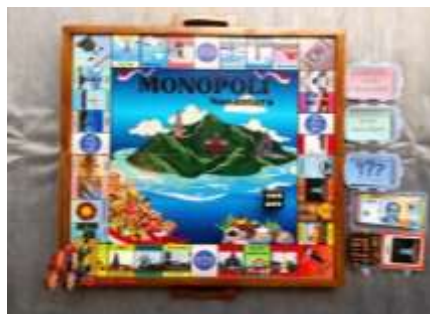
Gambar 2. Produk Akhir Media Monopoli Nusantara (MONUSRA)

Produk media yang telah dikembangkan kemudian melalui tahap uji validitas dengan tujuan untuk menilai tingkat kelayakan produk tersebut sebelum digunakan. Proses validasi media Monopoli Nusantara (MONUSRA) dilakukan oleh tiga validator ahli yang meliputi ahli materi, ahli media, ahli pembelajaran.