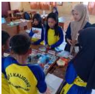
Gambar 3. Pelaksanaan Uji Skala Kecil