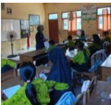
Gambar 4. Pelaksanaan Uji Skala Besar

Setelah pelaksanaan tahap awal skala kecil pada pertemuan pertama Pelaksanakan uji skala besar dilakukan untuk mengimplementasikan media Monopoli Nusantara (MONUSRA) pada kelompok peserta didik yang lebih luas. Kegiatan ini bertujuan untuk mengetahui praktikalitas dan evektivitas media dalam kondisi pembelajaran yang sebenarnya. Kegiatan pada pertemuan ini diawali dengan pengambilan data awal sebelum peserta didik menggunakan media pembelajaran Monopoli Nusantara (MONUSRA) pada uji coba skala besar, yaitu melalui pretest dan angket respon minat sebelum penggunaan media. Pelaksanaan kegiatan ini dilakukan dengan prosedur yang sama seperti pada uji coba skala kecil, namun diterapkan pada jumlah peserta didik yang lebih luas.