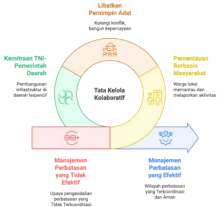
Gambar 1. Manajemen Perbatasan Kolaboratif

Dalam praktik di lapangan, ditemukan bentuk sinergi yang berjalan efektif antara berbagai aktor dalam tata kelola perbatasan Merauke. Salah satu praktik baik yang menonjol adalah implementasi program pengawasan perbatasan berbasis masyarakat, di mana warga lokal dilibatkan secara aktif dalam pemantauan wilayah dan pelaporan aktivitas lintas batas ilegal. Pelibatan tokoh adat dalam proses ini terbukti mampu meredam potensi konflik sosial dan meningkatkan kepercayaan antara aparat keamanan dan komunitas lokal. Selain itu, kemitraan strategis antara TNI dan Pemerintah Daerah (Pemda) dalam pembangunan infrastruktur dasar seperti jalan, pos pengawasan terpadu, dan fasilitas air bersih di daerah terpencil juga menjadi contoh nyata sinergi lintas sektor yang efisien. Kolaborasi ini tidak hanya mempercepat realisasi pembangunan, tetapi juga memperkuat kehadiran negara di kawasan perbatasan melalui pendekatan yang lebih inklusif dan kontekstual. Temuan ini menunjukkan bahwa tata kelola berbasis kolaborasi dan pemberdayaan lokal dapat memperkuat aspek pembangunan dan keamanan secara simultan.