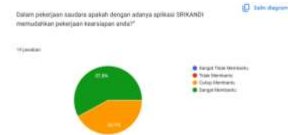
Gambar 2. Pra-Riset: Apakah Aplikasi SRIKANDI Memudahkan Pekerjaan Kearsipan?

Berdasarkan hasil observasi yang dilakukan pada Biro Umum Kementerian Hukum, ditemukan bahwa aplikasi SRIKANDI sangat menunjang pekerjaan pegawai tetapi belum optimal. Kendala yang dihadapi antara lain sering terjadinya error pada sistem saat menggunakan aplikasi, kurangnya pemahaman pegawai dalam penggunaan sistem elektronik, sehingga kurang efisien dalam waktu dan perlu adanya pembelajaran lanjutan. Hasil pra-riiset menunjukkan bahwa 57,9% pegawai menyatakan "Sangat Membantu" dan 42,1% "Cukup Membantu" terhadap penggunaan aplikasi SRIKANDI. Sementara itu, tingkat kemudahan penggunaan aplikasi menunjukkan 15,8% menyatakan "Tidak Mudah", 21,1% "Cukup", 31,6% "Mudah", dan 26,3% "Sangat Mudah". Secara keseluruhan, mayoritas pegawai telah merasakan kemudahan dalam menggunakan aplikasi SRIKANDI, namun masih terdapat sebagian kecil yang menghadapi kendala.