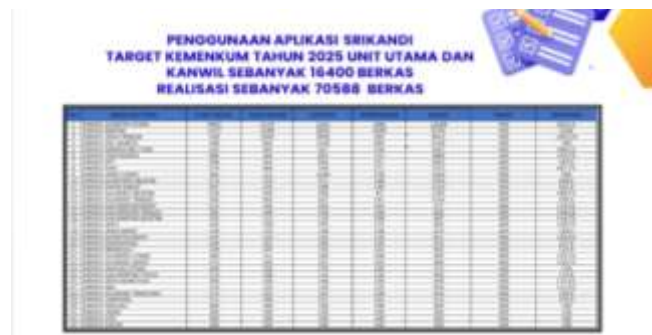
Gambar 1. Penggunaan Aplikasi SRIKANDI KEMENKUM 2025

Lembaga pemerintah sebagai pengelola kepentingan publik berhadapan dengan tuntutan masyarakat yang semakin tinggi terkait efisiensi pelayanan serta akuntabilitas dalam pengelolaan data dan informasi. Menurut Yusman et al. (2024), digitalisasi dalam administrasi tidak hanya memperbaiki efisiensi operasional, tetapi juga memperkuat kepercayaan serta meningkatkan pengelolaan dalam sebuah organisasi. Penelitian Aulianto (2024) mengemukakan bahwa setiap aspek, termasuk bidang kearsipan, memerlukan perubahan dan penyesuaian. Pemanfaatan perkembangan ilmu pengetahuan serta teknologi dapat mendukung pelaksanaan aktivitas kearsipan sehingga lebih efektif dan efisien. Tanpa pengelolaan arsip yang efektif, suatu organisasi berpotensi kehilangan jejak administratif, menghadapi keterlambatan dalam pelayanan, dan bahkan mengalami kerugian akibat hilangnya dokumen penting. Menurut Kuswantoro & Widyastuti (2021), tujuan penyelenggaraan kearsipan adalah untuk memastikan keamanan arsip sebagai bukti pertanggungjawaban atas pelaksanaan kegiatan pemerintahan.