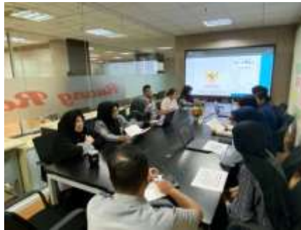
Gambar 6. Pelatihan Penggunaan Aplikasi Srikandi pada Pegawai

kecepatan internet yang lambat serta koneksi yang tidak stabil menjadi salah satu hambatan dalam implementasi sistem berbasis elektronik. Rochaeni et al. (2024) juga menemukan bahwa rendahnya konektivitas jaringan internet serta keterbatasan sumber daya manusia yang kompeten menjadi hambatan utama dalam implementasi sistem digital. Sadar & M. Riban Satria (2025) menegaskan bahwa ketidakstabilan jaringan internet dan keterbatasan fasilitas teknologi menjadi hambatan dalam sistem digital yang berdampak pada kelancaran proses kerja organisasi.