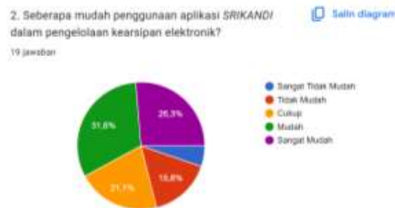
Gambar 3. Pra-Riset: Tingkat Kemudahan Penggunaan Aplikasi SRIKANDI

Berdasarkan hasil observasi yang dilakukan pada Biro Umum Kementerian Hukum, ditemukan bahwa aplikasi SRIKANDI sangat menunjang pekerjaan pegawai tetapi belum optimal. Kendala yang dihadapi antara lain sering terjadinya error pada sistem saat menggunakan aplikasi, kurangnya pemahaman pegawai dalam penggunaan sistem elektronik, sehingga kurang efisien dalam waktu dan perlu adanya pembelajaran lanjutan. Hasil pra-riiset menunjukkan bahwa 57,9% pegawai menyatakan "Sangat Membantu" dan 42,1% "Cukup Membantu" terhadap penggunaan aplikasi SRIKANDI. Sementara itu, tingkat kemudahan penggunaan aplikasi menunjukkan 15,8% menyatakan "Tidak Mudah", 21,1% "Cukup", 31,6% "Mudah", dan 26,3% "Sangat Mudah". Secara keseluruhan, mayoritas pegawai telah merasakan kemudahan dalam menggunakan aplikasi SRIKANDI, namun masih terdapat sebagian kecil yang menghadapi kendala.