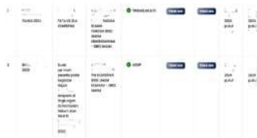
Gambar 5. Disposisi Surat pada Sistem Aplikasi Srikandi

Berdasarkan indikator kemudahan sistem informasi kearsipan dinamis menurut Iksaningtyas & Rukiyah (2019), aplikasi SRIKANDI telah memenuhi beberapa aspek penting: easy to learn (mudah dipelajari) dengan adanya panduan penggunaan seperti video dan media pembelajaran; controllable (dapat dikontrol) melalui kemampuan memantau status dokumen secara real-time ; clear and understandable (jelas dan mudah dipahami) dengan tampilan dan fitur yang memudahkan pengguna; flexible (fleksibel) karena dapat diakses kapan saja dan di mana saja; easy to become skillful (mudah dikuasai) di mana sebagian besar pegawai mampu menggunakan sistem; serta ease of use (mudah digunakan) dalam proses pencarian, penelusuran, dan distribusi dokumen.