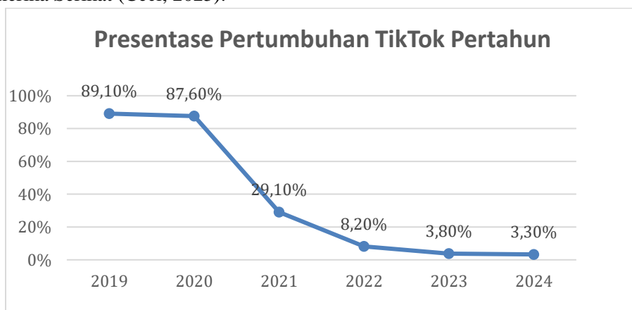
Gambar 1. Diagram Pertumbuhan Pengguna TikTok Di Amerika Serikat

Namun, tren pertumbuhan TikTok mulai mengalami perlambatan pada periode 2021 hingga 2024, yang bertepatan dengan masa pemerintahan Joe Biden. Penurunan laju pertumbuhan terjadi di tengah perhatian pemerintah Amerika Serikat terhadap isu keamanan digital, perlindungan data, serta potensi pengaruh asing melalui platform media sosial. pembahasan publik dan politik yang semakin intens mengenai resiko keamanan TikTok turut mempengaruhi dinamika penggunaan dan ekspansi platform tersebut di Amerika Serikat (Ceci, 2025).