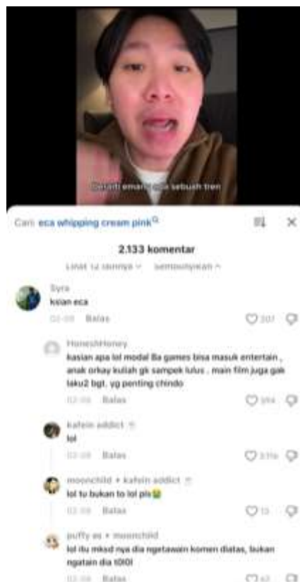
Gambar 2. Interaksi Audiens pada kolom komentar

tidak hanya menerima informasi dengan pasif, tetapi juga berpartisipasi secara emosional dalam diskusi yang berlangsung. Oleh karena itu, elemen emosi dalam konten ini berhasil menunjukkan kemampuan pesan yang disampaikan untuk memicu reaksi emosional dan mendorong audiens untuk memberikan tanggapan terhadap fenomena Whip Pink. Temuan ini sejalan dengan pendapat yang diutarakan oleh Dhia, Pramesthi, dan Irwansyah (2024) yang menyatakan bahwa emosi dalam komunikasi digital berfungsi dalam menciptakan keterlibatan emosional audiens, sehingga pesan yang disampaikan lebih mudah diterima dan mendapatkan respons dari pengguna media sosial.